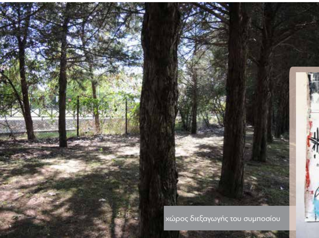
χώρος διεξαγωγής του συμποσίου