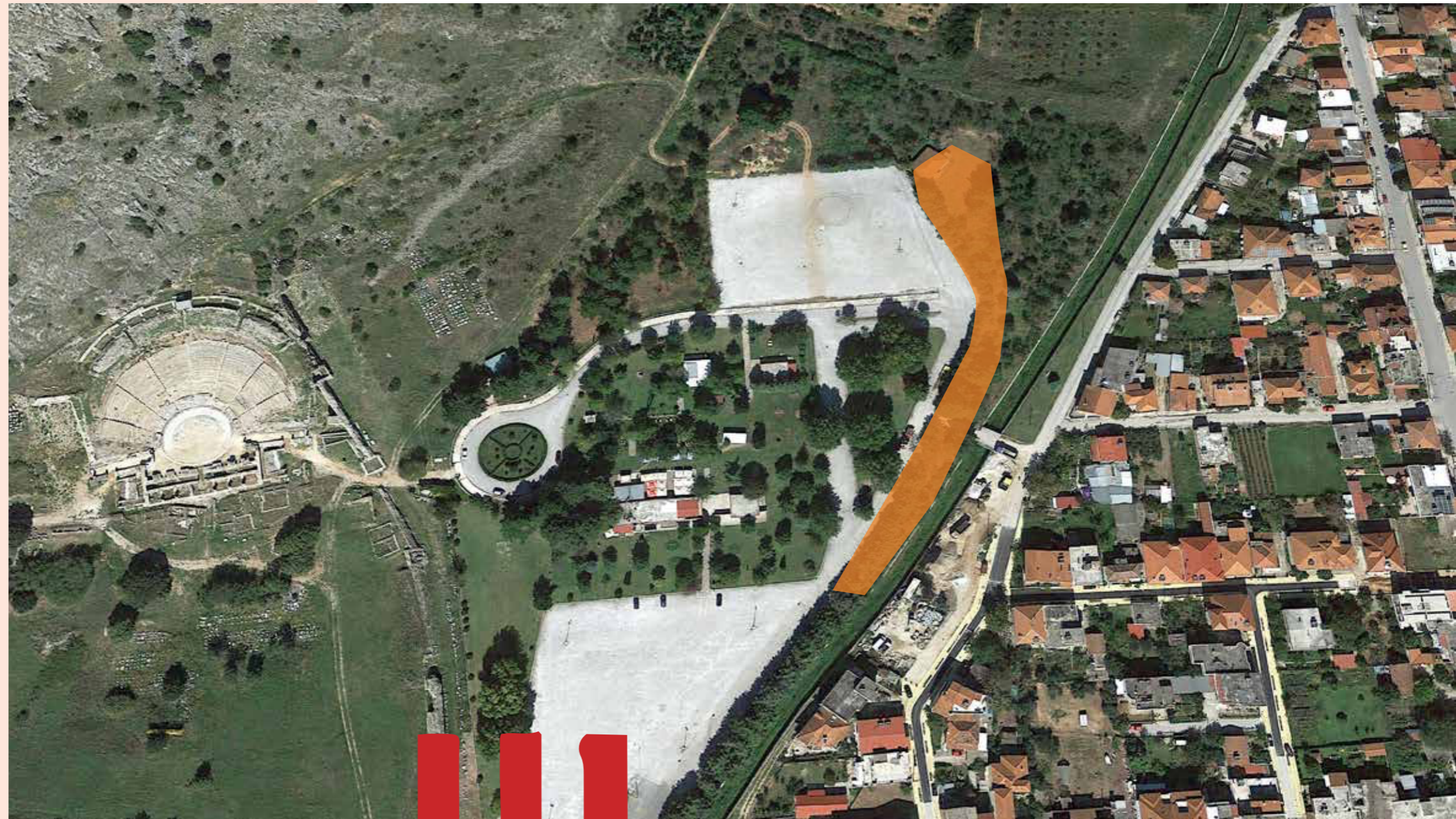
χώρος διεξαγωγής του συμποσίου

Εκεί, καλλιτέχνες & τοπική κοινωνία θα έχουν την ευκαιρία να έρθουν κοντά, να αλληλεπιδράσουν , να γνωριστούν, να ακουστούν.